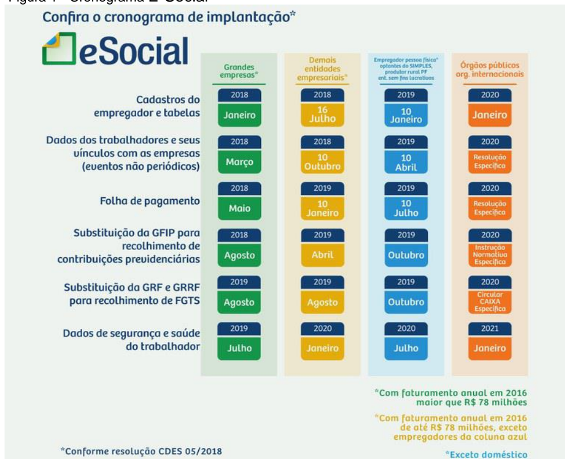
Figura 1 - Cronograma E-Social

O programa foi desenvolvido em 4 etapas, cada uma com 6 fases, conforme a figura abaixo: