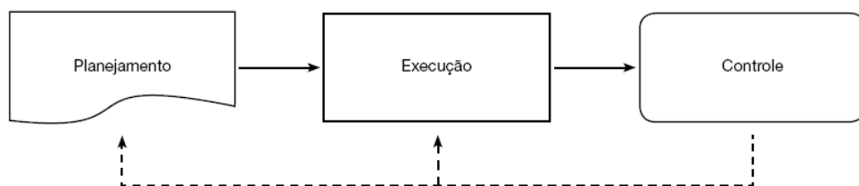
Figura 1: Integração entre os elementos que compõem o processo de gestão

Estas são as três etapas do processo de gestão em forma de figura apresentada por Raupp, Martins e Pietri (2006, p. 122):