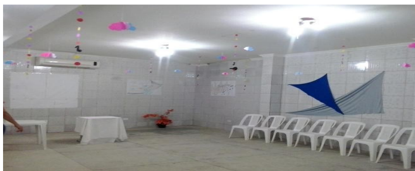
Figura 1 – Auditório da Escola organizado para a formação.

A realização de toda ação se deu na mesma escola campo da observação, especificamente no auditório que foi preparado previamente, para que pudesse ser um ambiente agradável para permanecer por 4 horas, numa manhã de sábado. O local foi decorado com cartazes temáticos relacionados as atividades que seriam realizadas e já indicando o que aconteceria, e também com alguns itens simplesmente decorativo (nuvens, notas musicais e bolinhas - confeccionados em papéis coloridos - e dispostos pendurados por náilon no teto), como mostra a figura 1 abaixo, para que pudesse transmitir leveza e um momento diferencial daquele já tido como rotina na vida dessas profissionais.