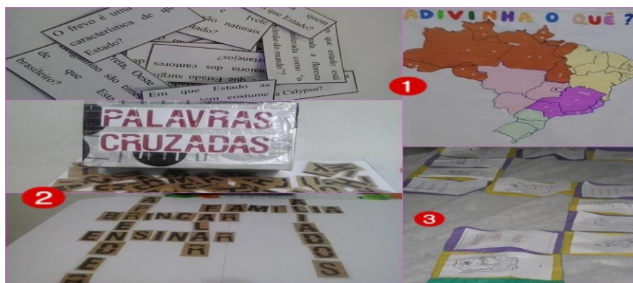
Figura 2 – Jogos utilizados para a formação, Geografia, Português, Ciências.

Assim, os jogos propostos foram desenvolvidos para trabalhar os conteúdos nas referidas disciplinas: (Língua Portuguesa: Palavras Cruzadas; Matemática: Bingo dos Sólidos Geométricos; Ciências: Trilha dos Vertebrados; Geografia: Adivinha o quê?). Como mostra a figura 2, abaixo, alguns desses jogos confeccionados.